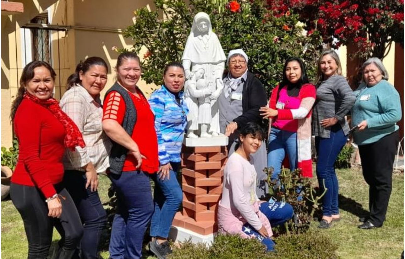
AFJM SANTA CRUZ (CUSHING - MALKY)