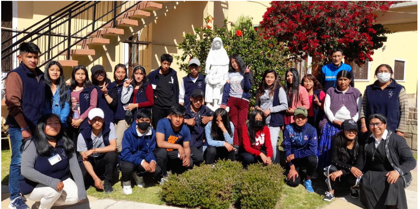
AFJM JESÚS MARÍA EL ALTO